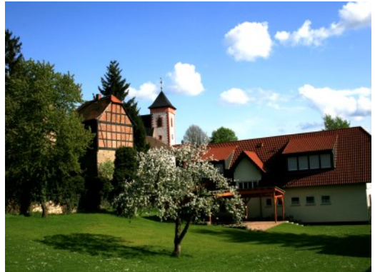
Pfarrgarten in Mittelbuchen

Sollten Sie kein Einladungsschreiben erhalten und Interesse daran haben, wenden Sie sich bitte an das Gemeindebüro.